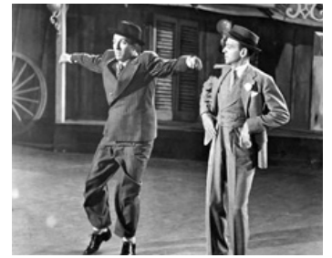
1946 LA MÉLODIE DU BONHEUR (Blue Skies) de Stuart Heisler avec Fred Astaire