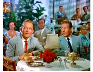
1954 NOËL BLANC (White Christmas) de Michael Curtiz avec Danny Kaye