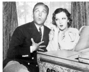
1943 DIXIE (Dixie) d'Edward Sutherland avec Dixie Lee