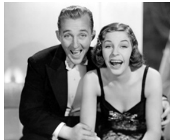
1937 QUITTE OU DOUBLE (Double or Nothing) de Theodore Reed avec Martha Raye