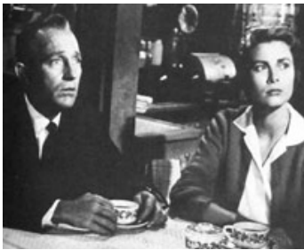
1954 UNE FILLE DE LA PROVINCE (Country Girl) de George Seaton avec Grace Kelly