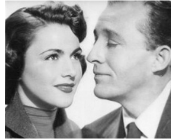
1953 LE PETIT GARÇON PERDU (Little Boy Lost) de George Seaton avec Nicole Maurey