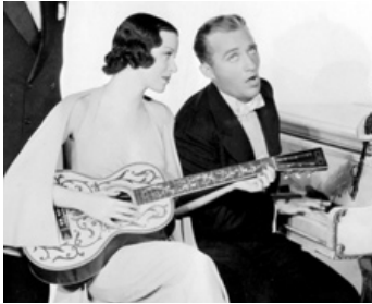
1934 HERE IS MY HEART de Frank Tuttle avec Kitty Carlisle