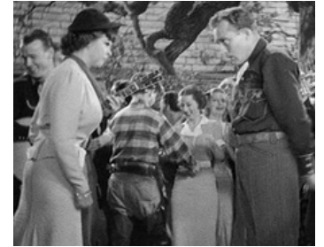
1936 RHYTHM ON THE RANGE de Norman Taurog avec Roy Rogers, Martha Raye