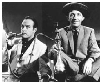
1962 ASTRONAUTES MALGRÉ EUX (The Road to Hong Kong) de Norman Panama avec Bob Hope