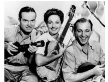
1940 EN ROUTE VERS SINGAPOUR (Road to Singapore) de V. Schertzinger avec D. Lamour