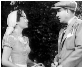
1949 QUAND VIENDRA L'AURORE (Top o' the Morning) de David Butler avec Ann Blyth