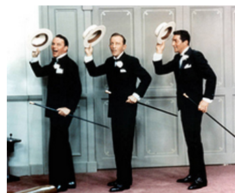
1964 LES 7 VOLEURS DE CHICAGO (Robin and the 7 hoods) de G. Douglas avec F. Sinatra, D. Martin