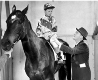
1938 BÉBÉS TURBULENTS (Sing your Sinners) de Wesley Ruggles avec Donald O'Connor