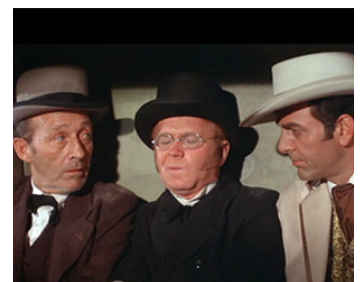
1966 LA DILLIGENCE VERS L'OUEST (Stagecoach) de G. Douglas avec Red Buttons, Mike Connors