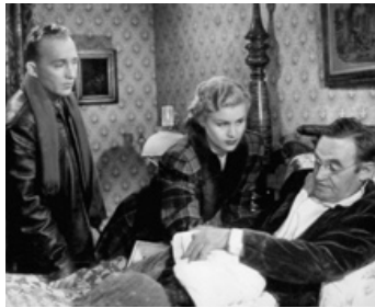
1947 LE DOCTEUR ET SON TOUBIB (Welcome Stranger) d'Elliott Nugent avec Joan Caulfield, Barry Fitzgerald