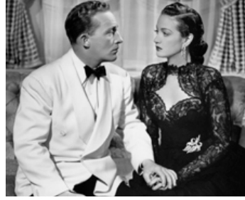
1947 EN ROUTE VERS RIO (Road to Rio) de Norman Z. McLeod avec Dorothy Lamour