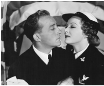
1944 LA MARINES EN JUPONS (Here come the Wave) de Mark Sandrich avec Betty Hutton