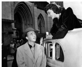
1940 RHYTHM ON THE RIVER de Victor Schertzinger avec Mary Martin