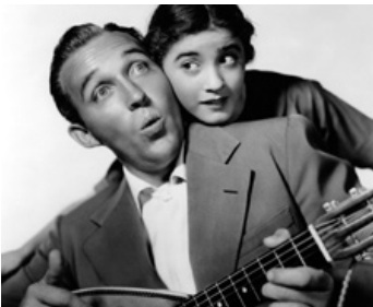
1936 LA CHANSON À DEUX SOUS (Pennies from Heaven) de Norman Z. McLeod avec Edith Fellowes