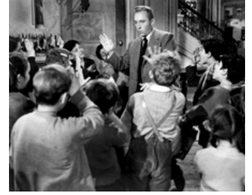
1951 SI L'ON MARIAIT PAPA (Here comes the Groom) de Frank Capra