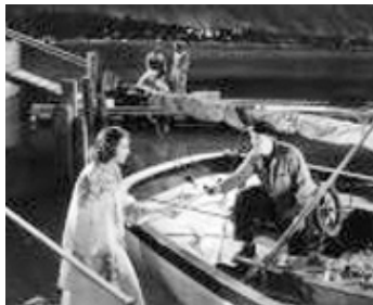
1937 MARIAGE À WAIKIKI (Waikiki Wedding) de Frank Tuttle avec Shirley Ross