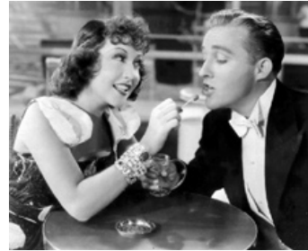
1936 TRANSATLANTIC FOLLIES (Anything Goes) de Lewis Milestone avec Ethel Merman