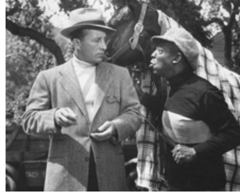
1950 JOUR DE CHANCE (Riding High) de Frank Capra avec Clarence Muse