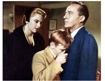
1957 MAN ON FIRE de Ranald McDougall avec Mary Pickett