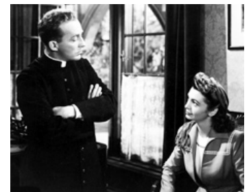
1944 LA ROUTE SEMÉE D'ÉTOILES (Going my Way) de Leo McCarey avec Jean Heather