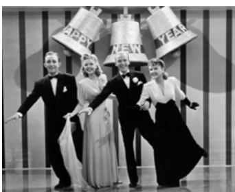
1942 L'AMOUR CHANTE ET DANSE (Holiday Inn) de Mark Sandrich avec F. Astaire V. Dale, M. Reynolds