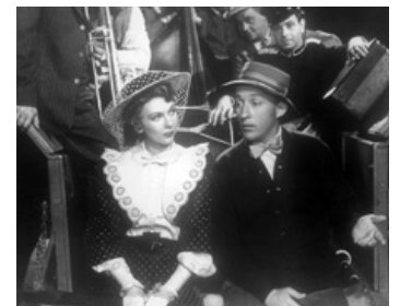
1941 CAVALCADE DU RHYTHME (Birth of the Blues) de Victor Schertzinger avec Mary Martin