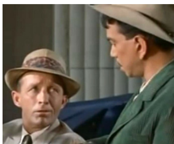
1960 PÉPÉ (Pepe) de George Sidney avec Cantinflas