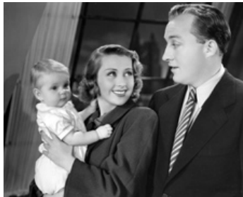
1939 EAST SIDE OF HEAVEN de David Butler avec Joan Blondell