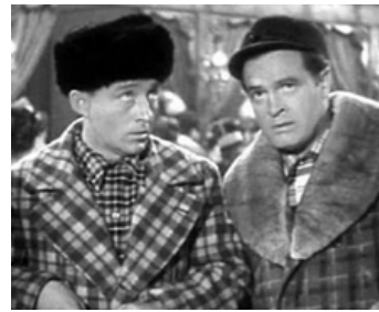
1946 EN ROUTE VERS L'ALASKA (Road to Utopia) de Hal Walker avec Bob Hope