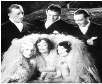
1930 LE ROI DU JAZZ (The King of Jazz) de John M. Anderson avec Brox Sisters, Rythm Boys