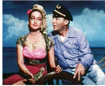
1952 BAL À BALI (Road to Bali) de Hal Walker avec Dorothy Lamour