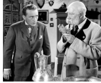
1948 LA VALSE DE L'EMPEREUR (The Emperor Waltz) de Billy Wilder avec Richard Haydn