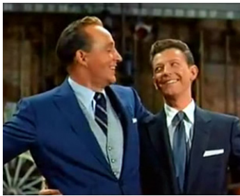
1956 QUADRILLE D'AMOUR (Anything Goes) de Robert Lewis avec Donald O'Connor