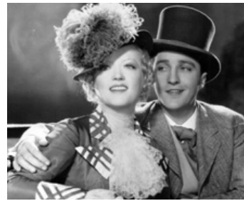
1933 AU PAYS DU RÊVE (Going Hollywood) de Raoul Walsh avec Marion Davies