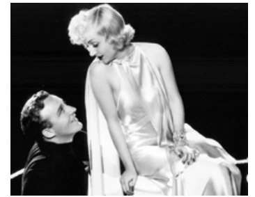
1934 WE'RE NO DRESSING de Norman Taurog avec Carole Lombard