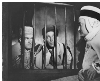
1942 EN ROUTE VERS LE MAROC (Road to Morocco) de David Butler avec Bob Hope