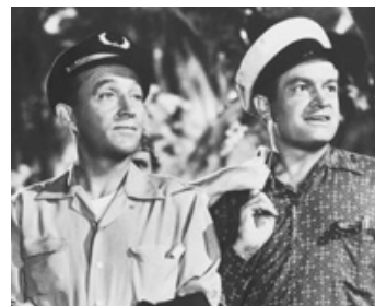
1941 EN ROUTE VERS ZANZIBAR (Road to Zanzibar) de V. Schertzinger avec Bob Hope