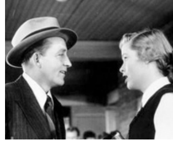
1950 MONSIEUR MUSIQUE (Mr Music) de Richard Haydn avec Nancy Olson