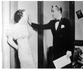
1933 COLLEGE HUMOR de Wesley Ruggles avec Mary Carlisle