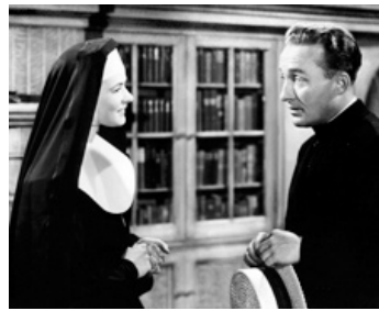
1945 LES CLOCHES DE SAINTE-MARIE (The Bells of St. Mary's) de Leo McCarey avec I. Bergman