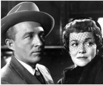
1952 POUR VOUS MON AMOUR (Just for You) d'Elliott Nugent avec Jane Wyman