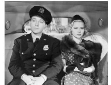
1938 DR RHYTHM (Doctor Rhythm) de Frank Tuttle avec Mary Carlisle