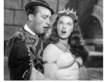
1949 UN YANKEE À LA COUR DU ROI ARTHUR (A Connecticut Yankee) de T. Gamett avec R. Fleming